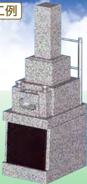
0.5 m 2 和型