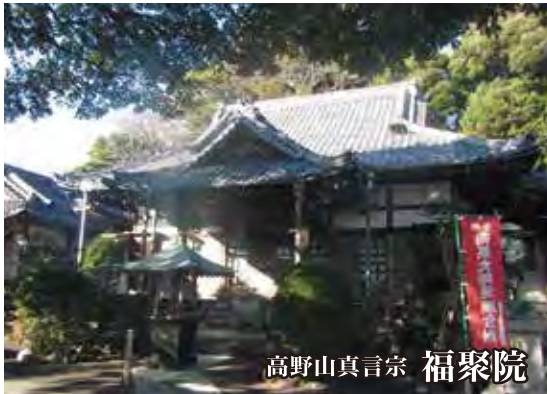
高野山真言宗 福聚院