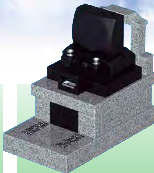
1.8 m 2 洋型