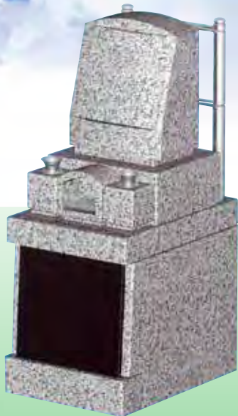
0.5 m 2 洋型